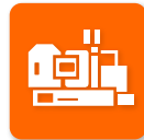
ダイカストマシン

※産業ヒートポンプ、高効率コージェネレーションは申請先が異なるため、ご注意ください。