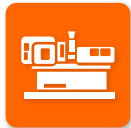
プラスチック加工機械